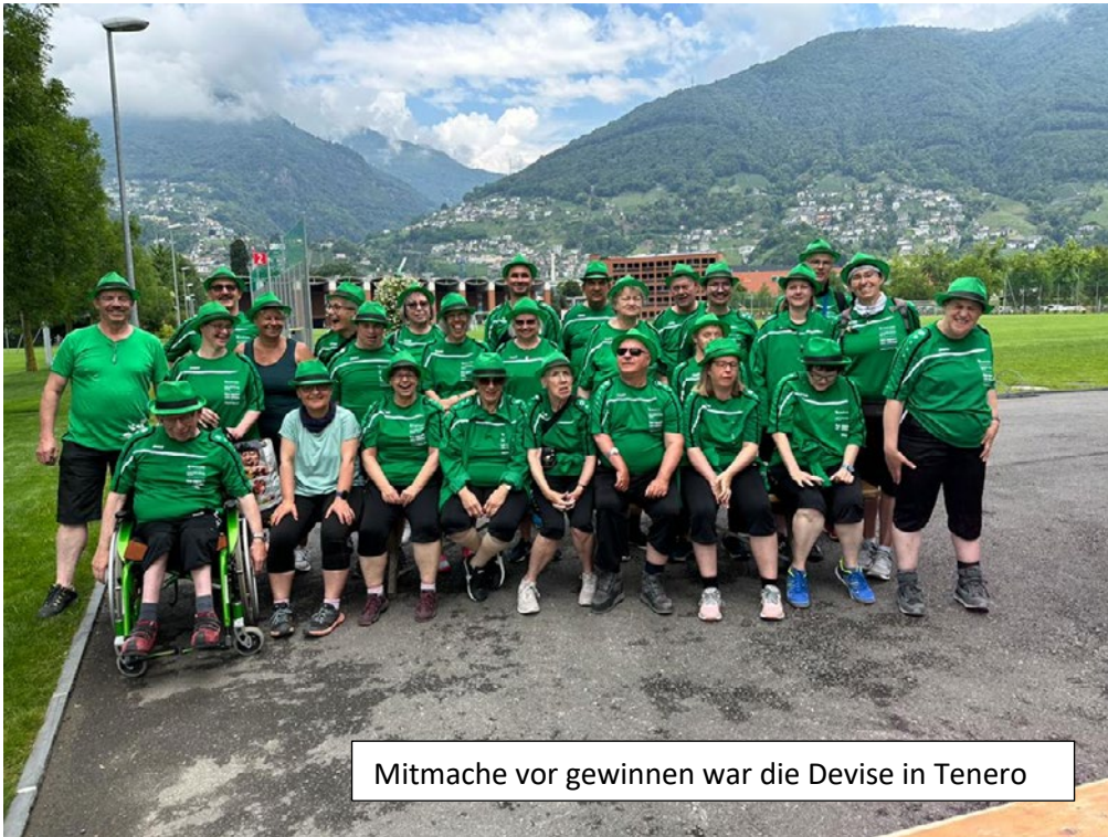
Mitmache vor gewinnen war die Devise in Tenero

Eine grosse Procap Sportgruppe der Sektion March-Höfe besuchte die Bewegungs- und Begegnungstage 2023 in Tenero im schönen Tessin