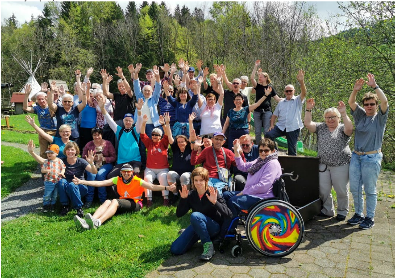
Eine aufgestellte Truppe von Procap March-Höfe und Schwyz genossen den gemeinsamen Bummel