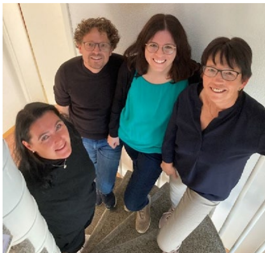
Team Geschäftsstelle Pfäffikon SZ