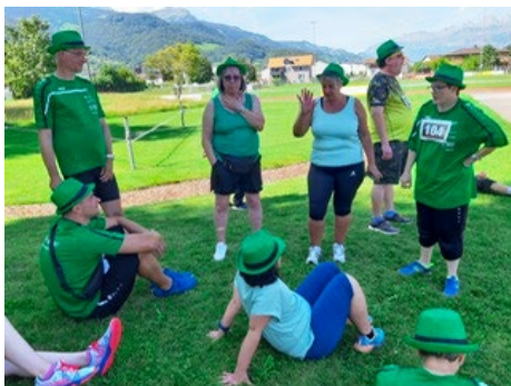
Briefing und Information vor dem Start am Sporttag in Sargans am 2. September 2023