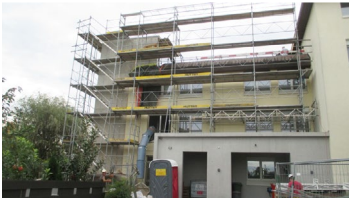
Ja, das Höfli wächst von Tag zu Tag