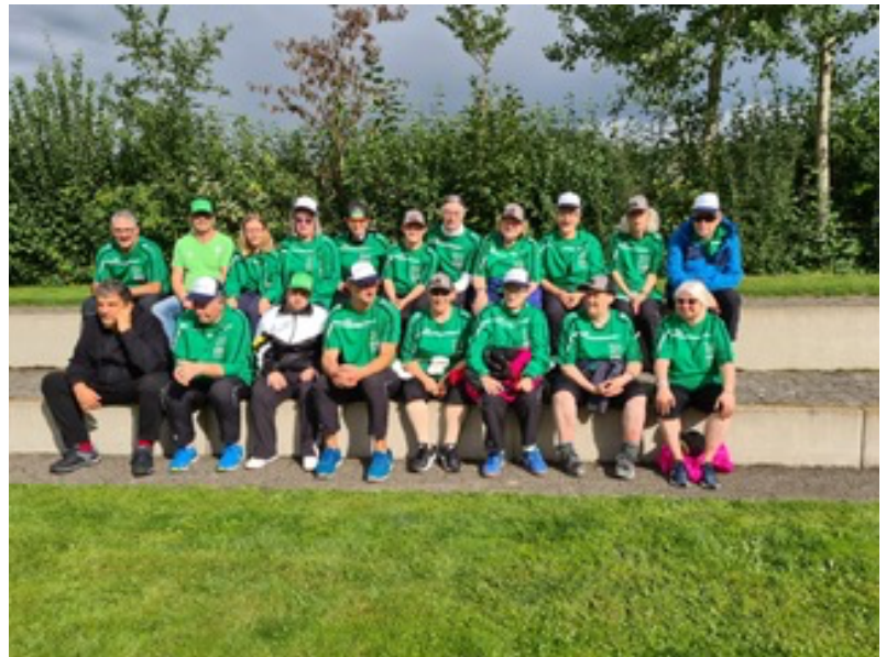
Gruppenbild vom Bütschwiler Sportanlass