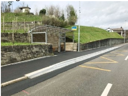
Vielenorts werden im Kanton SZ die Bushaltestellen angepasst. „Machet wieter e so“

Für die Gesellschaft, für Menschen mit Handicap, für die ältere Generation aber auch für Familien mit Kinderwagen ist die neue Formulierung korrekt und macht Freude, insbesondere wenn die Vorgaben auch ohne Wenn und Aber umgesetzt werden.