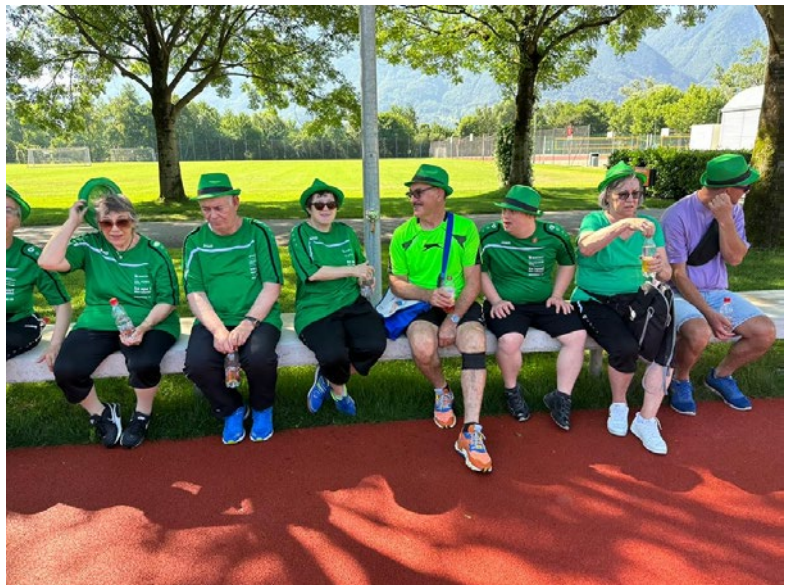
Warum nicht auch etwas pausieren